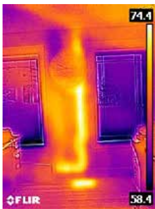
Теплая отводная труба в стене