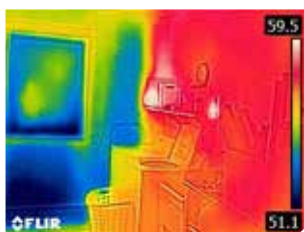
Неизолированная наружная стена